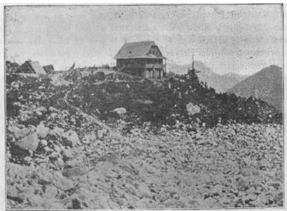
Češka koč med gradnjo. Vir: Planinski vestnik

Razstava osvetljuje bogato zgodovino češko-slovenskega planinskega sodelovanja, katerega simbol ostaja Češka koč, ena najstarejših in najbolj prepoznavnih planinskih postojank v Kamniško-Savinjskih Alpah. Skozi zgodovinske fotografije, dokumente in pripovedi predstavlja vezi med češkimi in slovenskimi planinci ter pomen, ki ga je imela Češka koč pri razvoju planinstva in kulturnih stikov med narodom.