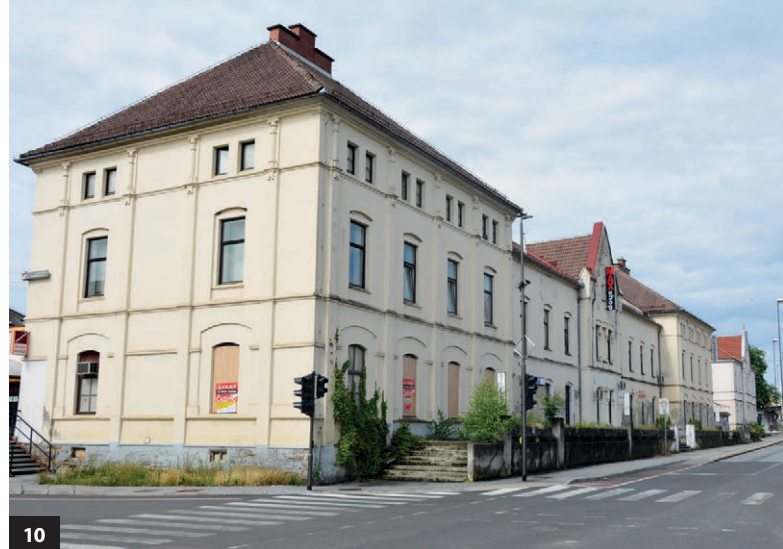
Slika 10: Pogled na nekdanjo domobransko vojašnico ob Ulici kraljeviča Marka (dokumentacija ZVKDS OE Maribor)

Območje meljske vojašnice je prav tako kraj pomembnih zgodovinskih dogodkov. Na tem mestu je 1. novembra 1918 general Rudolf Maister Maribor razglasil za posest jugoslovanske države in prevzel vojaško poveljstvo nad mestom in mejnim območjem na Štajerskem. Hkrati je iz meljske vojašnice kot zbirnega taborišča, obdanega z bodečo žico, nemški okupator v času od leta 1941 do 1945 izgnal ali prisilno mobiliziral več kot 80.000 Slovencev.