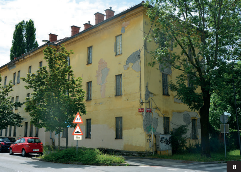
Slika 8: Stavba nekdanjega skladišča topniške vojašnice ob Ulici Pariške komune