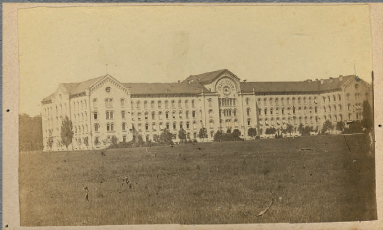
Fotografija kadetnice, [60. leta 19. stoletja]