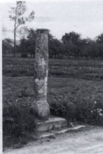
Leta 1961 je stal na podstavku samo stebler starega slavinskega križa

liko in položajem v prostoru sodijo med najbolj dragoceno kulturno in krajinsko dediščino Pivke in hkrati so eno izmed njenih najbolj reprezentativnih in razpoznavnih znamenj.