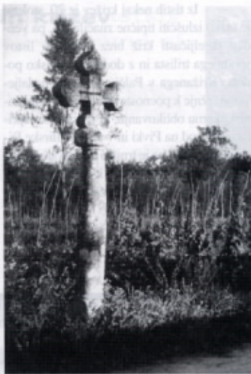
Stari slavinski križ 1956. leta, potem ko je bil prvič razbit in popravljen Fotografija: Leo Vilhar, 1956. Hrani fototeka Natrjanskega muzeja v Postojni.

Našteti križi so vaška, obpotna in poljska znamenja, ki praviloma stojijo na začetku ali na sredi vasi, ob cestah in poteh, najraje na križpotjih, včasih sredi polja. Nič čudnega, da jih je toliko stalo vzdolž reške ceste: od Kazarja pri Postojni do Radohove vasi kar osem. Nekateri so na vzpetinah, na vidnejših točkah, izjemoma tudi na višjem hribu daleč od naselij, kakršen je Osojnica. Ti in drugi kamniti križi s svojo značilno ob-