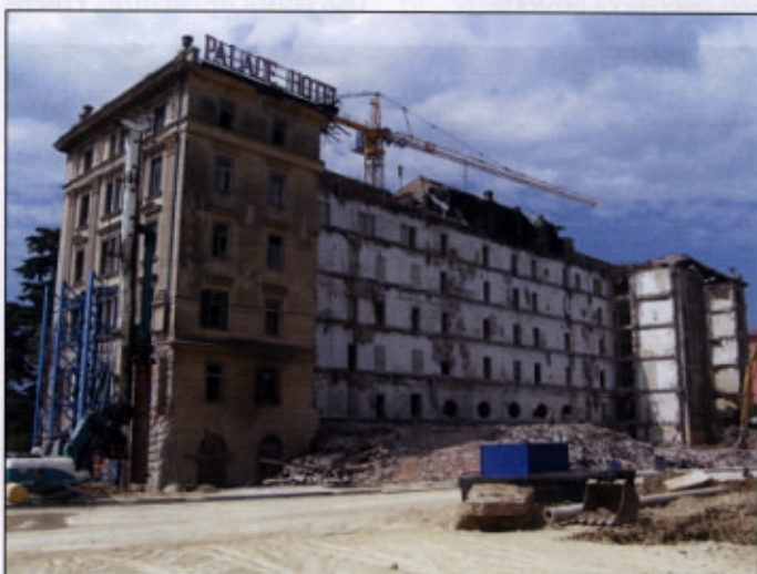
Zadnja stran hotela Palace

najpomembnejši spomenik te vrste. Glede na njegov pomen je vsekakor smiselno, da se v največji možni meri ohrani njegov avtentični zunanji in notranji izgled s pridihom nostalgije. Tako obnovljen hotel z ustreznimi vrhunskimi uslugami bo znova privabljal najbolj petične goste, s tem pa bo zagotovljena tudi poslovna uspešnost.