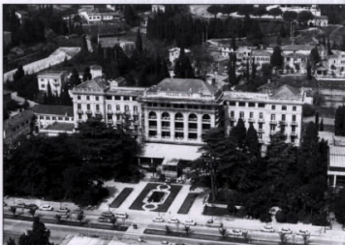
Palace hotel pred desetletji

Zanimivo in nasprotno od današnjih predstav turistične dejavnosti je, da so bili tovrstni hoteli grajeni predvsem kot zdravilišča, ki so skozi celo leto gostom nudila zdravo naravno okolje in mirno bivanje. Da je bilo bivanje gostov v hotelu Palace na ekskluzivno visoki ravni, nam potrjujejo ne le njegova razkošna oprema, temveč tudi družabni prostori: spre-