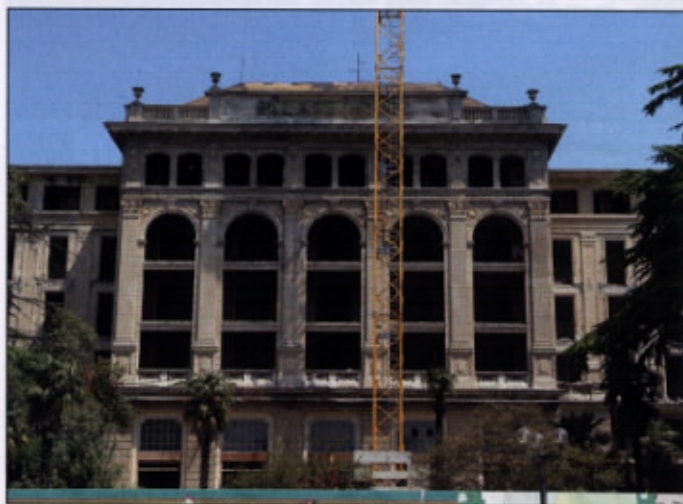
Začetek sanacije hotela Palace (posnetek 26. 6. 2006)

Po neuspešnih poizkusih obnove hotela Palace v osemdesetih in devetdesetih letih prejšnjega stoletja je končno dozorel čas, ko se k obnovi pristopa z zavestjo, da je to naš edini in