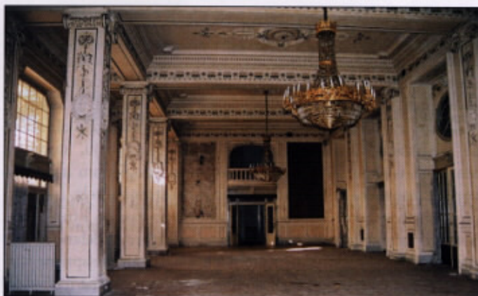
Ostanek nekdanjega blišča kristalne dvorane

natančno izrezanih šablon, s katerimi so mojstri nanašali apneno štuko maso. Ob oceni stanja je bilo ugotovljeno, da je velik del štukaturnega okrasja slabo pritrjen na podlago zaradi zarjavelih sider, posamezni deli pa razpadajo zaradi izpiranja veziva v štukaturni masi.