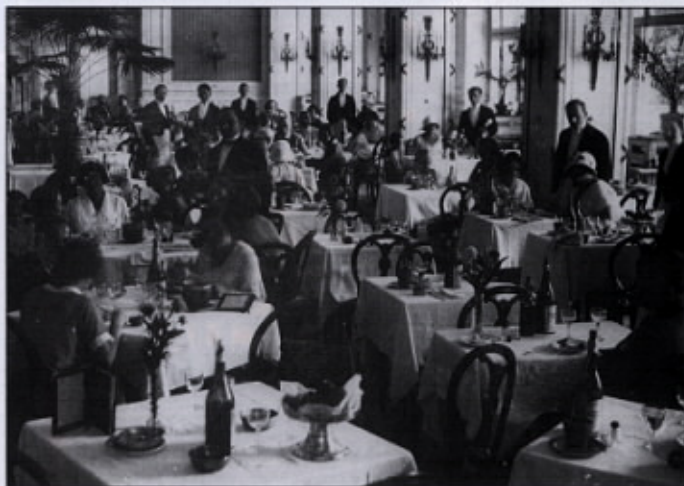
Kristalna dvorana nekoč