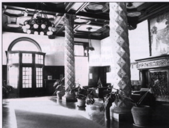
Recepcija v zlatih časih hotela

izvirnih sestavin, ki je posledica preobširnih gradbenih rekonstrukcij, neposredno vpliva na znižanje vrednosti spomenika. V primeru, da bi s štukaturami bogato okrašeno hotelsko dvorano spremenili v dolgočasno halo brez okrasja, bi s tem znižali tudi ceno storitev, ki jih ponuja hotel. Zato je cilj restavratorskega poseganja v sestavine arhitekture ohraniti pristnost in s tem vrednost spomenika. Restavratorska dela, ki so v stavbah, kot je palača hotela Palace, izjemno obsežna, ne dovolijo splošnega pristopa, temveč morajo temeljiti na predhodnih raziskavah, dogovorjenih tehnologijah restavratorskih posegov in izmerjenih količinah, ki so sestavine konservatorsko-restavratorskega projekta.