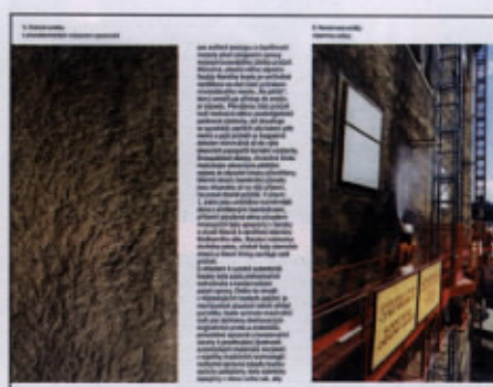
Primer utrjevanja ometa z apneno vodo na fasadi gradu v Češkem Krumlovu (iz brošure Obnova a konzervace zapadniho pručeli Horni hrad, Češki Krumlov )

Apnena voda (»apneni cvet«) je voda, ki ostane v apneni jami na površini gašenega apna. Lahko jo pripravimo tudi sami, in sicer v 1 volumen čiste vode raztopimo 1/3 volumna gašenega apna, pomešamo in pustimo stati nekaj časa, da se kalcij izloči v vodo in apno posede. Z apneno vodo večkrat škropimo omet (v nekaterih primerih tudi 90-krat ali več), dokler mu ne povmemo bazičnosti, ki jo je s časom izgubil.