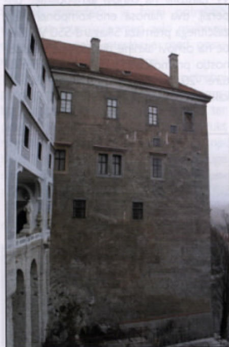
Češki Krumlov, konserviran gotski omet na zahodni fasadi gradu

Fasada baročne kulise je bila izdelana leta 1741, v štuko ometu, to je 2 mm precizno