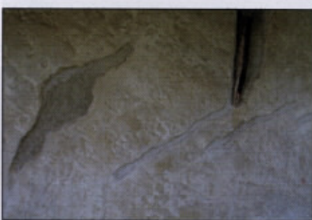
Grad v Pišecah (zgoraj) in detalj dopolnjevanja baročnega ometa na vzhodni fasadi (spodaj)

ilame vlage, na ostali fasadi so manjkale le manjše zaplate, na nekaj mestih pa je omet odstopil od podlage. Na praznih mestih so se najprej obšli robovi izvirnika, nato pa po plasteh zapolnila z grobim (živo-apnena malta, apno : pesek = 1 : 7) in finalnim apnenim ometom (gašeno-apnena malta, apno : pesek = 1 : 3). Površina novih zaplat se je izenačevala z izvornikom z gostim apnenim opleskom (gašeno apno : voda = 1 : 5).