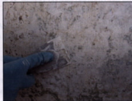
Vtiskovanje apnene mase v površinske razpoke ometa

kamo apneno malto oziroma pri površinskih mrežnih razpokah apneno maso. Odvečno apno, ki se nabere na površini, sproti odstranjujemo z gobico.