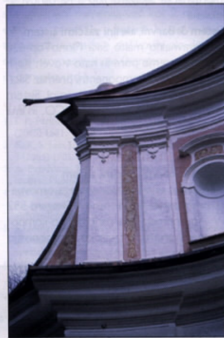
Ohranjen stari štuko omet, dopolnjen z novim na pilastrih baročne kulise fasade v Kostanjevici na Krki