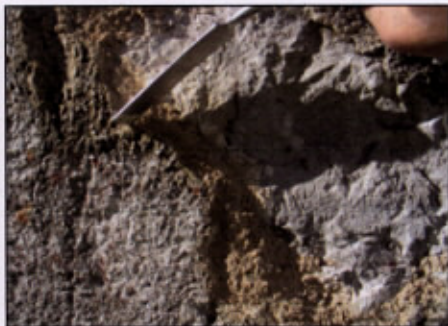
Obšivanje prvotnega ometa, Štanjel