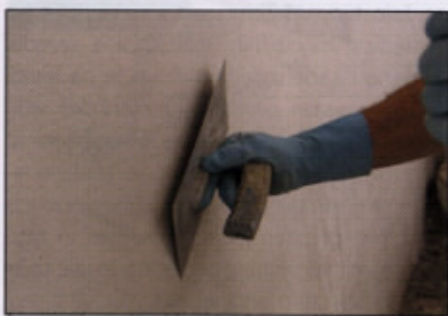
Fasada Paplerjeve hiše v Škofji Loki (zgoraj) in detalj izvedbe glajenega apnenega ometa (spodaj)

vendar niso bili na srečo nikdar odstranjeni stari ometi. Tako se je ohranil star grobi omet in na nekaj mestih sledi poslikave, iz katerih je bilo možno rekonstruirati značilno črno-belo fasadno členitev, ki je bila v 16. stoletju v Škofji Loki zelo moderna. Okrog napisne plošče je bila najdena že zelo obledela fresko poslikava. Ob obnovi fasade so bili odstranjeni samo vrhni beleži in slabo sprijete preperle zaplate ometa. V razpoke je bila vtisnjena redka apnena masa, nove zaplate so bile izvedene v apnenem ometu, katerega površino je izvajalec prilagajal ohranjenim delom. Celota je bila nato prebeljena z apnenim beležem ter na novo preslikana s členitvijo.