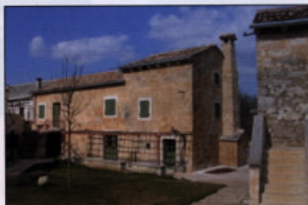
Hrvaška Istra, obnovljena apnena fasada, barvana z naravnim pigmentom iz istrske zemlje

Primer takega načina obnove je na primer ohranitev gotske fasade gornjega gradu v Češkem Krumlovu. Ali pa središče Stockholma, s katerim se švedska stroka kot z izjemnim uspehom uporabe tradicionalne apnene tehnologije ponaša že zadnjih dvajset let. Tak način obnove so osvojili tudi Hrvati, Francozi in Italijani, ki znajo obnavljati fasade, »ne da bi bile videti kot nove«.