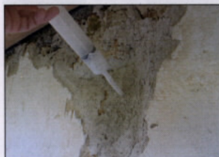
Primeri injektiranja zaplate ometa, Prapreče pri Lukovici (zgoraj) in Pišce (spodaj)