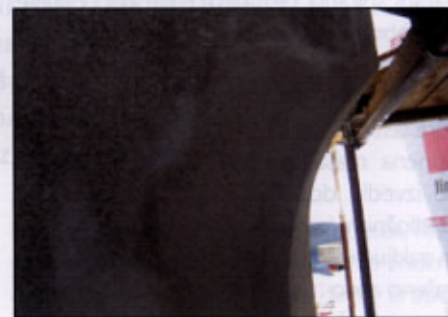
Primer izenačene površine starega in novega ometa, Škofja Loka

Ob vsem tem je nujno upoštevati pogoje dela, ki jih zahteva apnena tehnologija. Vsakršno prehiteno tempo, neupoštevanje zahtevanih temperatur za strjevanje malt, zanemarjanje negovanja ometa po nanosu se nam maščuje z značilno posledico: po prvi zimi se začne omet plastiti in drobiti. Ponavadi krivimo slabo apno, a v resnici je krivo neupoštevanje pogojev, ki jih apno zahteva. Kot opazovalci se moramo navaditi, da pri obnovi fasade z naravnimi materiali te »spregovorijo« drugače. To pomeni, da po obnovi niso izdelane v enoviti, gladki barvni obdelavi, ki prekrje fasado kot »preliv torte«, kar je na žalost današnjemu okusu všečno in je posledica množičnih industrijskih izvedb. Apnene fasade izgledajo drugače: na fasadi ostanejo opazni prvotni ohranjeni deli, vidi-jo se sledovi ročne izvedbe, uporabljeni so naravni materiali in izvedba je tradicionalna – z uporabo apna, ki jo danes obvlada le še redko kateri zidarski mojster in zato tudi to znanje postaja dediščina. In vse to bi morala postati merila lepega.