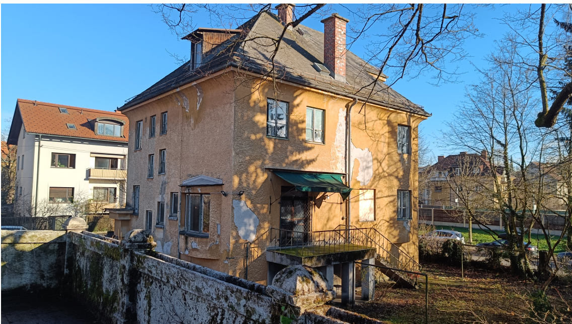
Vili Pick se obeta celostna prenova.