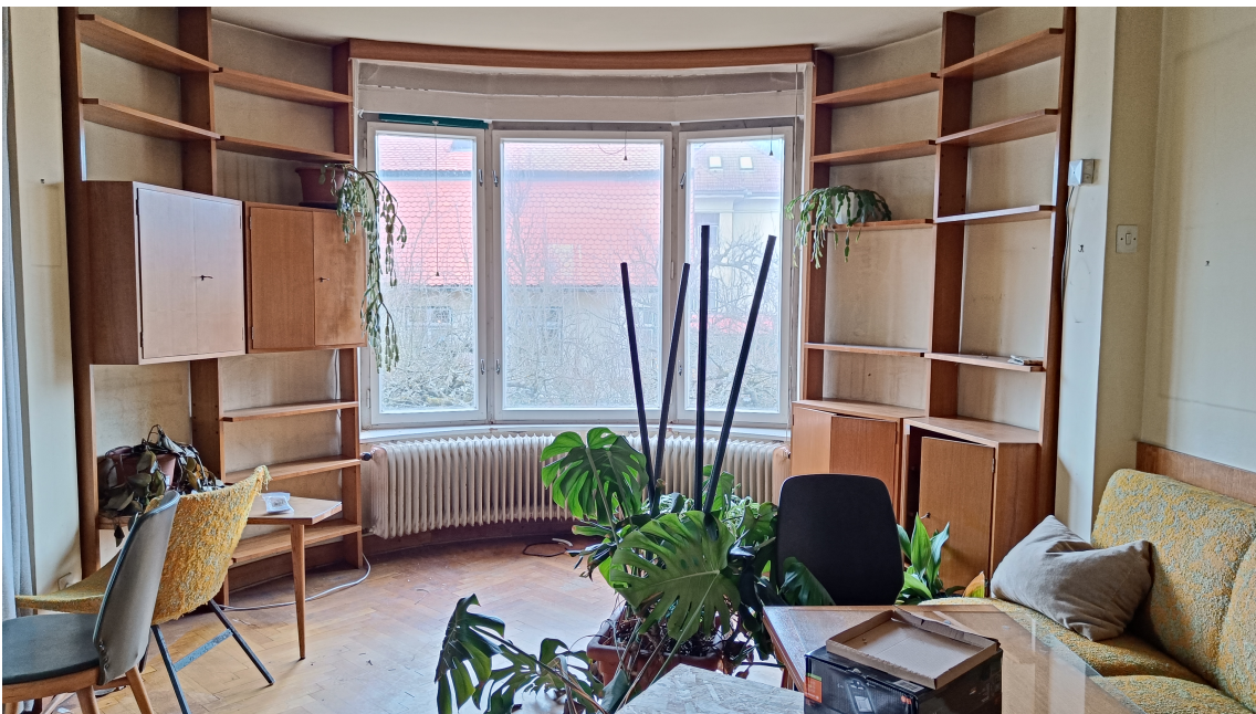
Polkrožni izzidki se odražajo tudi v tlorisu in po meri izdelano noprotrano opremo.