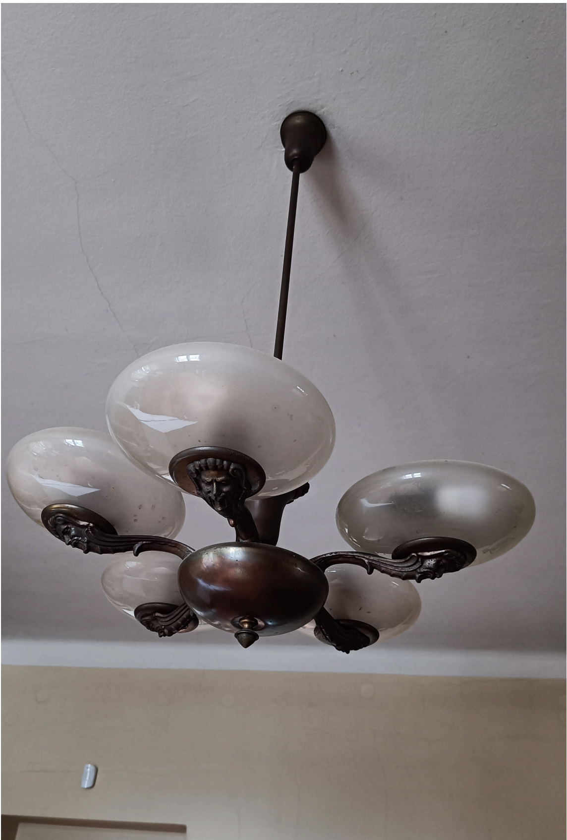
Največje presenečenje so ohranjeni lestenci. Vir: Fototeka ZVKDS, avtorica Hana Brus, 2024.