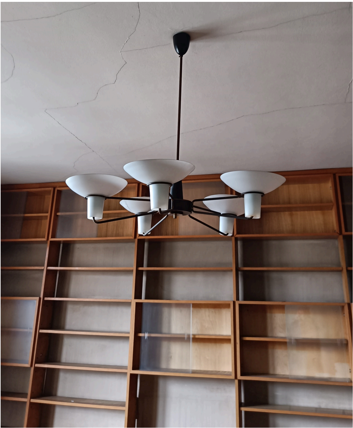
Ohranjena je notranja oprema z izstopajočimi lestenci.