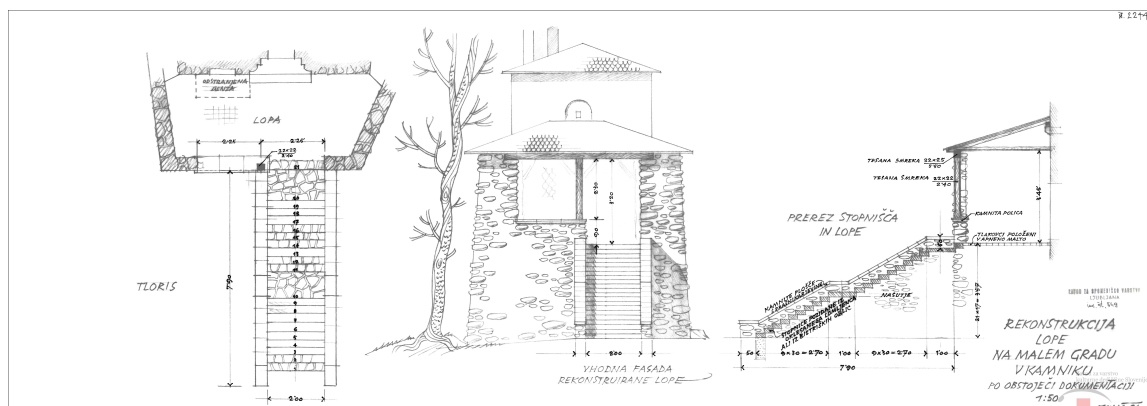
Načrt za preureditev, Kamnik - Mali Grad, arhiv ZVKDS.