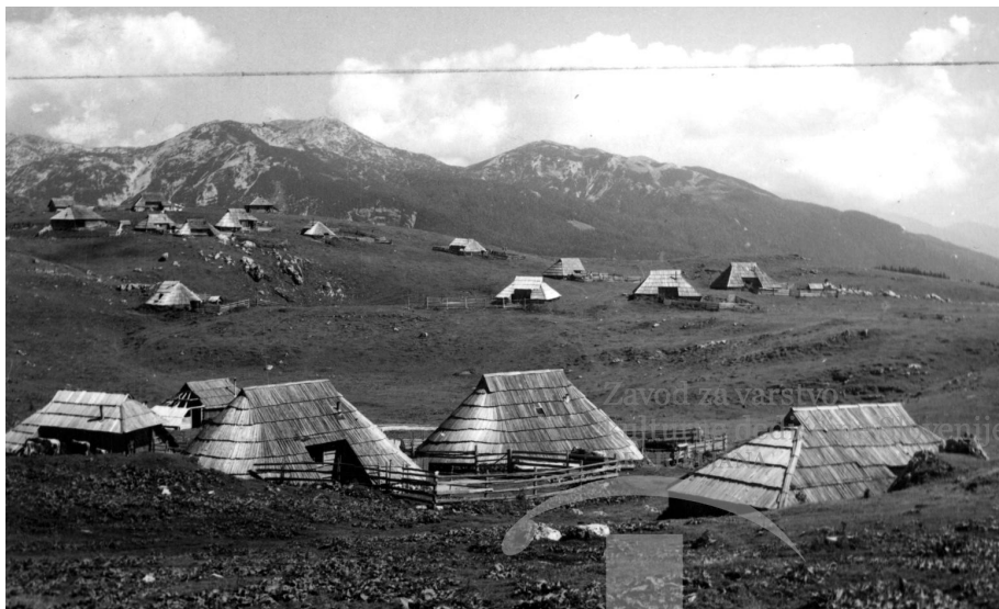
Velika planina leta 1962, arhiv ZVKDS.