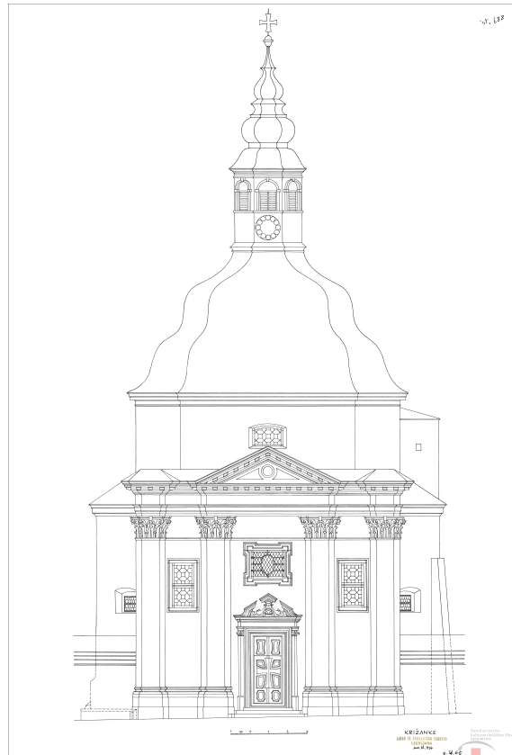
Načrt križevniške cerkve, arhiv ZVKDS.

Izrisal več kot 37 serij načrtov za posamezne objekte: cerkve, gradove in profane stavbe ljubljanske baročne arhitekture