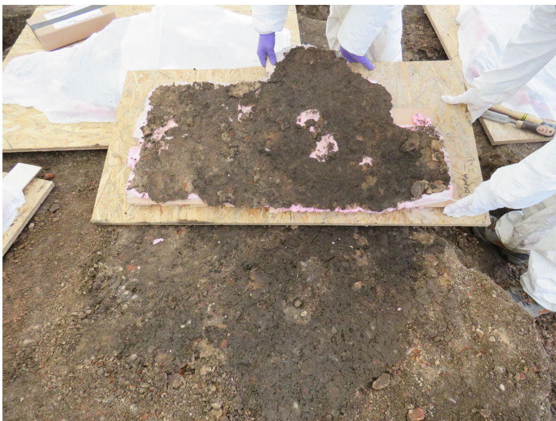
Fragment nukleusa, ločen od podlage, vidna tudi popolnoma strohnjena plast nukleusa pod mozaikom, arhiv ZVKDS.