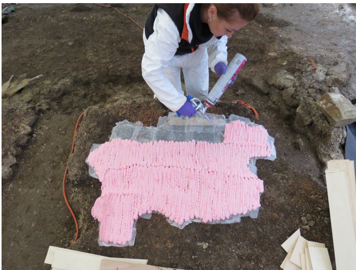
Nanos prve plasti nizko ekspanzijske poliuretanske pene in lesenih letvic za izdelavo armature, arhiv ZVKDS.