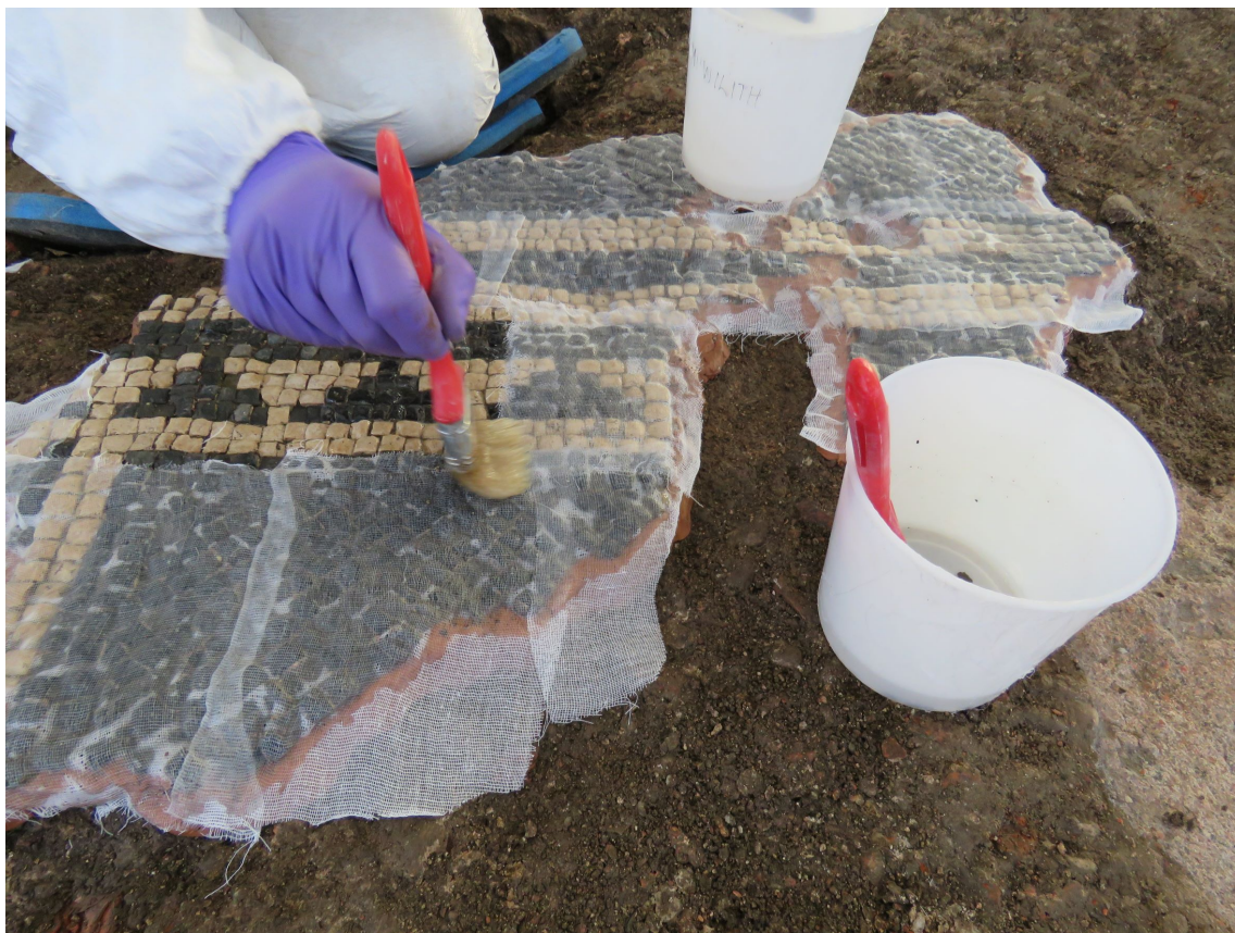
Lepljenje prve od dveh plasti zaščite