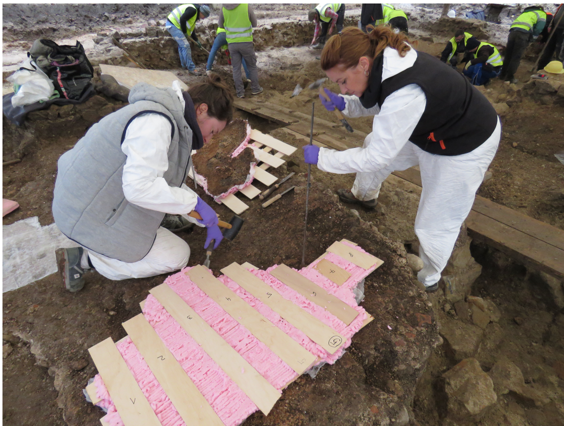
Ločevanje mozaika od podlage.