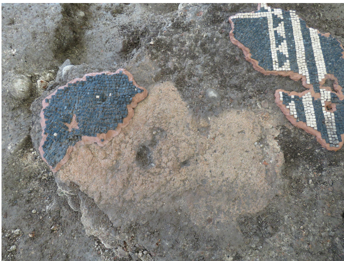
Fragmenta mozaika in del nukleusa (omet pod mozaičnimi kockami), očiščeni in pripravljeni na nadaljnje postopke