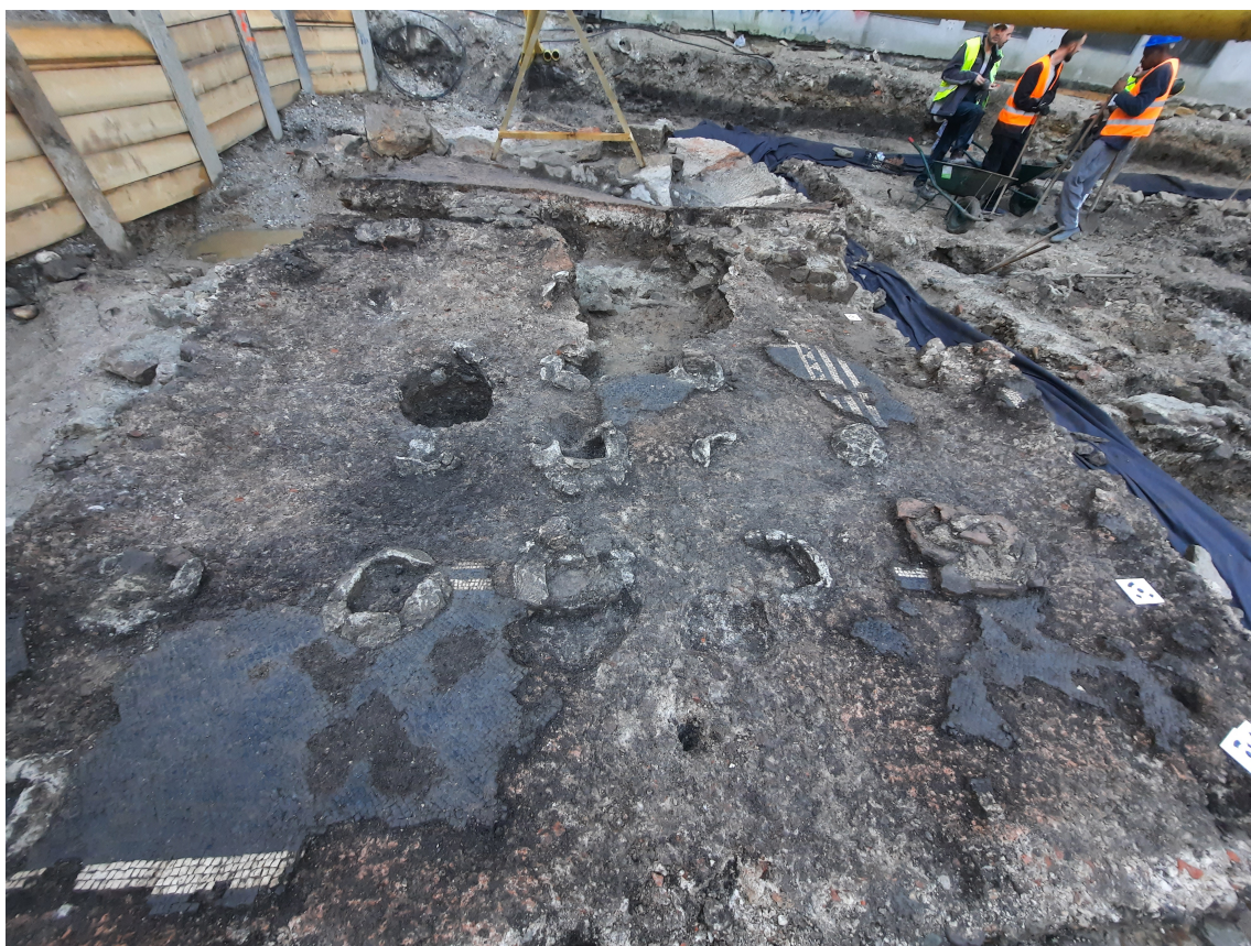
Fragmenti mozaika

Zbrala in uredila Barbara Colarič, ZVKDS