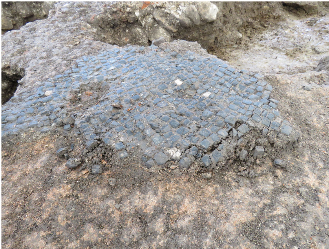
Stanje enega od fragmentov pred začetkom del – zelo nestabilen rob

zaščitna armatura, ki nam je olajšala dvig od podlage. Fragmente se je z dleti in posebnimi kopji postopno ločilo od podlage, nato so bili z licem navzdol položeni na lesene deske. Čeznje je bila pritrjena gaza, ki bo omogočila njihovo sušenje in nudila zaščito med prevozom v depo Mestnega muzeja Ljubljana.