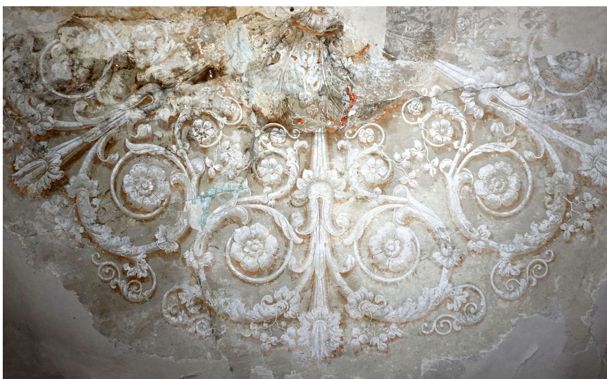
Odkrita centralna rozeta na stropnem delu v SV stolpu, foto: arhiv ZVKDS.