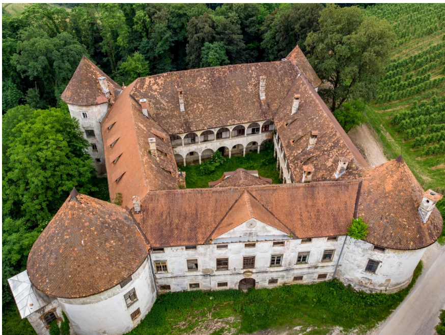
Šrajbarski turn iz zraka