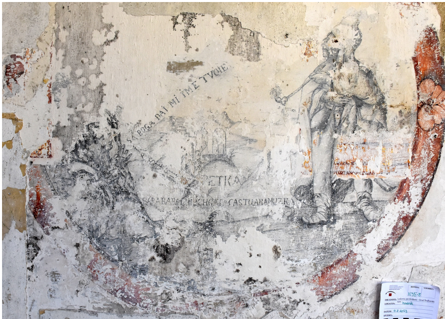
Odkrit medaljon na arkadnem hodniku z naslikanima figurama, gradom, cerkvico ter posameznimi napisi, foto: arhiv ZVKDS.