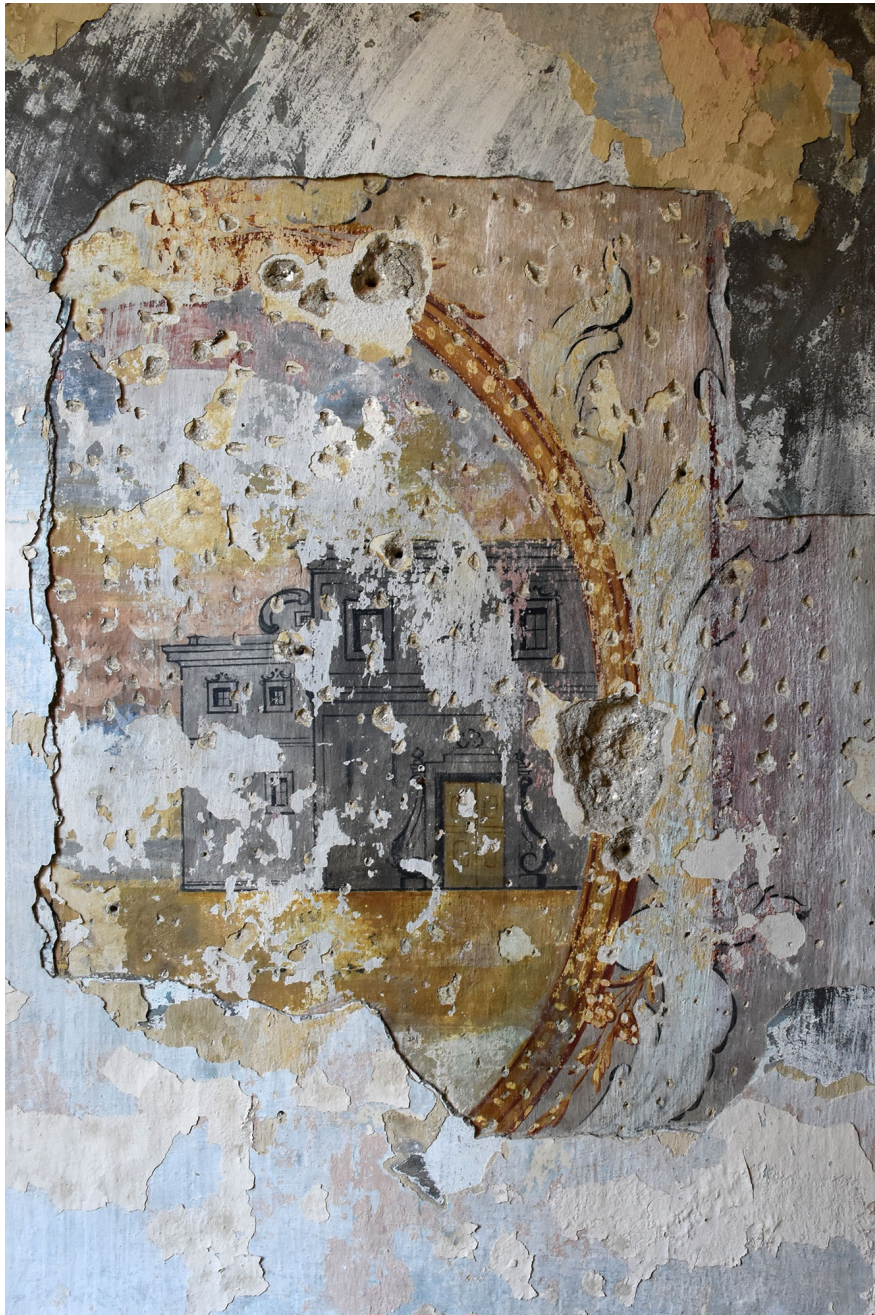
Naslikan grad z veduto v medaljonu, okenska špaleta v SV stolpu, foto: arhiv ZVKDS.

Izvedeni konservatorsko restavratorski postopki so potrdili, da je na stenah in stropih objekta, vključno z zunanjim arkadnim hodnikom prvega nadstropja, ohranjeno večje število izjemno kvalitetnih in umetnostno zgodovinsko pomembnih poslikav, oz. poslikanih plasti, neprecenljive vrednosti, med katerimi še posebej izstopajo najstarejše ročno poslikane poslikave v bivanjskih prostorih, ročna poslikava z motivom vedute gradu in cerkve ter dveh figur v medaljonu na arkadnem hodniku južnega trakta gradu, odkriti rokopisi v okenskih špaletah, prvine, ki nam s svojo vsebino oživljajo grad, njihova nadaljnja umetnostno-zgodovinska analiza pa bo zagotovo dopolnila historično zgodbo o gradu in življenja na njem.