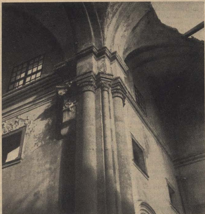
Kostanjevica, snop stebrov ob prezbiteriju samostanske cerkve

Zavod za varstvo spomenikov LRS s sedežem v Ljubljani je centralna naredbodajna in izvršilna republiška ustanova za varstvo in proučevanje kulturnih spomenikov in prirodnih znamenitosti na ozemlju Slovenije ter deluje pod vodstvom ministra za prosveto LRS. Zakaj osrednja ustanova? Možno je namreč, da bodo po potrebi ustanovljene tudi nekakšne podružnice ali ekspoziture Zavoda, konservatorski uradi z manjšim delokrogom in določenim pokrajinskim ali krajevnim področjem, na drugi strani pa lahko sodelujejo z njim tudi drugi zavodi in druge ustanove. Zavod je naslednik bivšega Spomeniškega urada, ki je bil ustanovljen 1913 in ki se je osamosvojil v bivši Jugoslaviji kmalu po prvi svetovni vojni. Današnji Zavod pa je po svojem pomenu in delokrogu bistveno nova ustanova, ki ji določajo delovni obseg in razvoj novi kulturni in ekonomski pogoji FLRJ. Konservatorji bivšega Spomeniškega urada, ki je prenehal delovati z ustanovitvijo Zavoda oktobra 1945, so mogli upravljati samo ožje strokovno področje, to je predvsem varstvo umetnostnih spomenikov. Z vodstvom bivšega Spomeniškega urada je bilo združeno največ odkrivanje in metodično proučevanje umetnostnega spomeniškega gradiva, tolmačenje njegove umet-