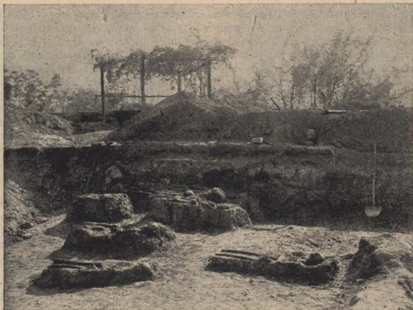
Del staroslovanskega grobišča na gradu v Ptuj

tudi na keramičnih fragmentih kot podlogi. Skupno število odkritih ognjišč na relativno zelo majhnem prostoru znaša 23. Veliko število keramičnih izdelkov in fragmentov, najdenih okoli ognjišč in razsutih po terenu, nam nudi kaj pestro sliko. Kulturno lahko opredelimo vso to ostalino v dve skupini, ki sta pa tesno povezani med seboj. Plastičnih izdelkov je malo — samo torzo neke statuete. Čuditi se je velikemu številu kamenitih kladiv in sekir kakor tudi manjšemu številu nožičev iz kremenca, kljub davni dobi. Medtem pa je kovinastih predmetov najdenih kaj malo, vsega skupaj par bronastih igel in puščic. Prazgodovinska naselbina ni trajala dolgo in časovno spada v prehodni čas konca bronaste dobe.