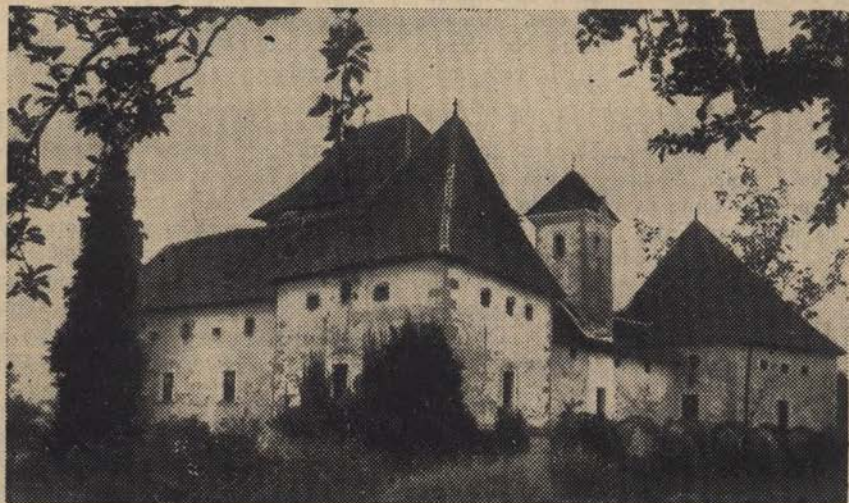
Grad Gracarjev turn (Tolski vrh) na Dolenjskem pred požarom

Stolpu, to je najzgodnejši obliki fevdalne arhitekture, se pridružujejo objekti, ki navadno postopoma rasejo na obzidju ter oklepajo jedro v krogu, čigar obliko določa zunanji rob stavbnega terena. Večina naših gradov pripada temu sklenjenemu tipu (Stari grad, Klevevž, Gracarjev turn itd.). Primer strnjenegega tipa pa se nam je ohranil v gradu Mirna, kjer so