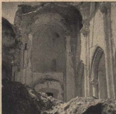
Kostanjevica, pogled v cerkev proti zahodu pred očiščenjem ruševin

znak oblike iztegnjene črke S s črto na gornjem koncu (ta bo najbrž kasnejši), dva kompliranejša znaka in dva kljukasta križa, ki pa ju je nekdo iz nerazumevanja uničil, čeprav nimata z nemštvo nobene zveze ampak sta le pogost romanski kamnoseški znak.