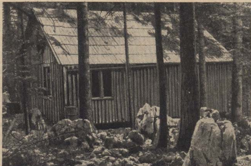
Kočevski Rog, z baze T20, baraka IOOF zgrajena v poletju 1944

1. Spomeniki aktivnega oboroženega odpora in večje politične pomembnosti. a) Poslopja, v katerih so bili izvršeni važni, ves osvobodilni pokret zadevajoči sklepi. b) Sedeži in baze vrhovnih političnih in vojaških organov, prvi bunkerji in taborišča prvih partizanskih borcev in voditeljev. c) Točke in baze važnejših partizanskih tehnik in tiskarn. č) Važne partizanske bolnišnice. d) Množični grobovi partizanskih borcev. e) Kraji smrti narodnih herojev. f) Kraji ustanovitve prvih brigad. g) Kraji in položaji važnejših borb. h) Vse področje Kočevskega roga, kjer je bil najdlje sedež vrhovnih osvobodilnih organov in bil kompleks SCVPB in tiskarne.