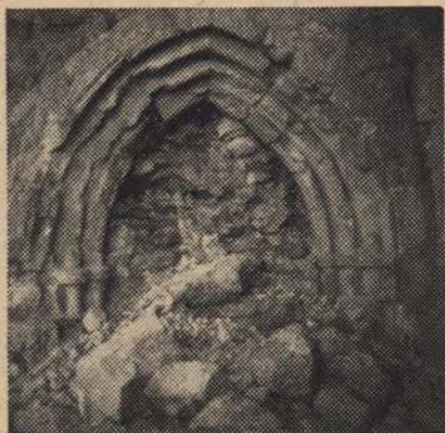
Kostanjevica, gotski portal iz 13. stol.