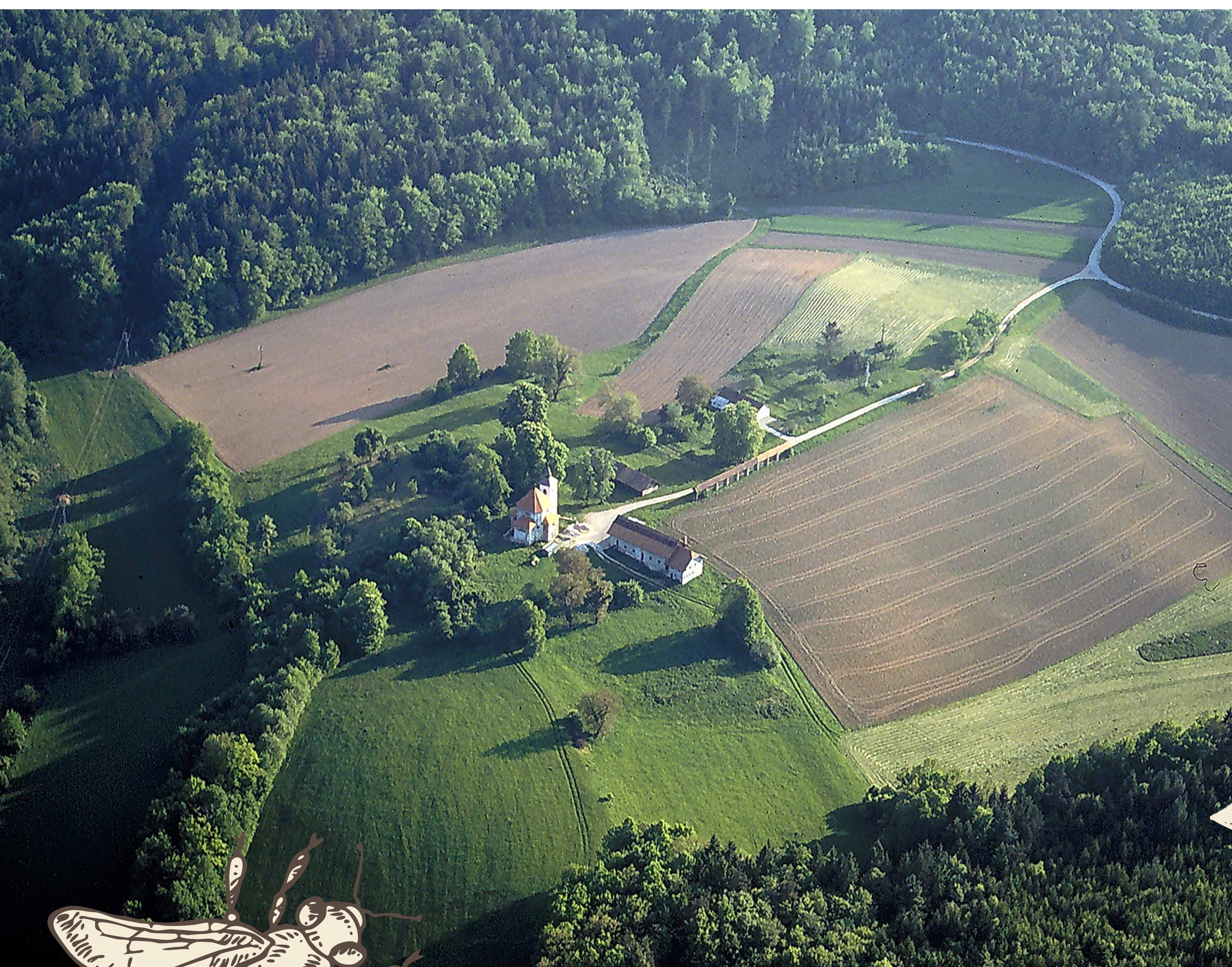
Lanšprež iz zraka.

Razstava ob 300-letnici rojstva Petra Pavla Glavarja