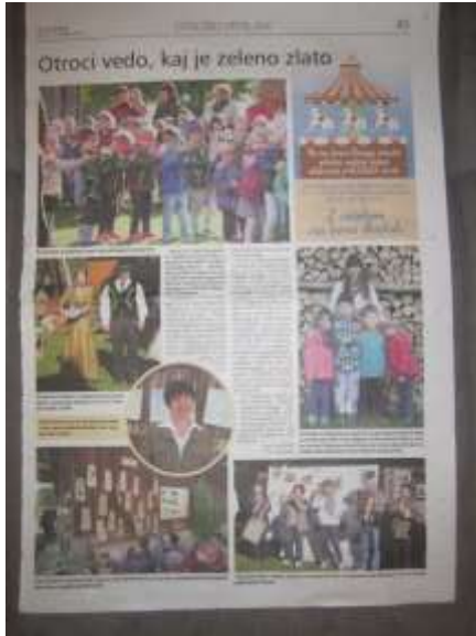
OBJAVA V NOVEM TEDNIKU (regionalni tednik) 13. 10. 2016