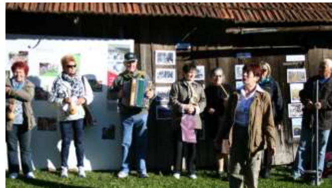
V OKVIRU MEDGENERACIJSKEGA SODELOVANJA PRISLUHNEMO GLASBENI SKUPINI DU ŠEMBIS