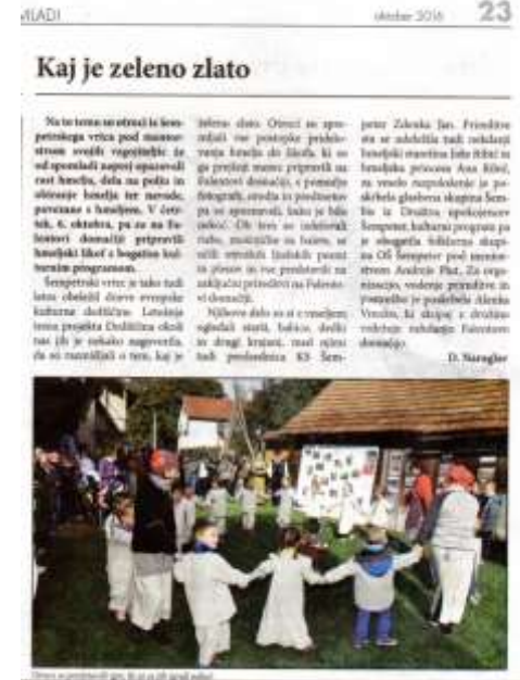
OBJAVA V UTRIPU Savinjske doline (mesečnik) oktober