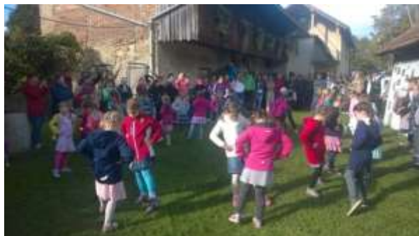
PRIREDITEV SI OGLEDAJO STARŠI, DEDKI, BABICE, KRAJANI, PRESEDNICA KS, TURISTIČNEGA DRUŠTVA...