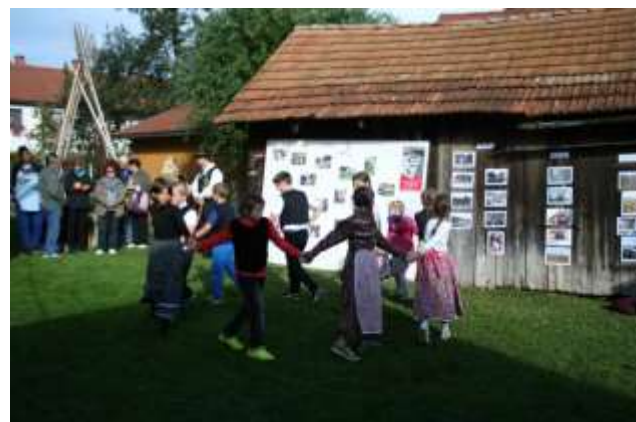
ZAPOJE IN ZAPLEŠE TUDI FOLKLORNA SKUPINA OŠ ŠEMPETER