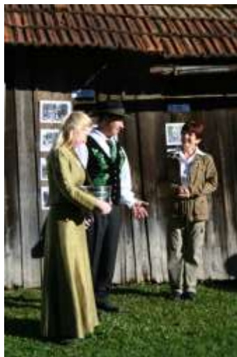
HMELJARSKI STAREŠINA IN PRINCESA