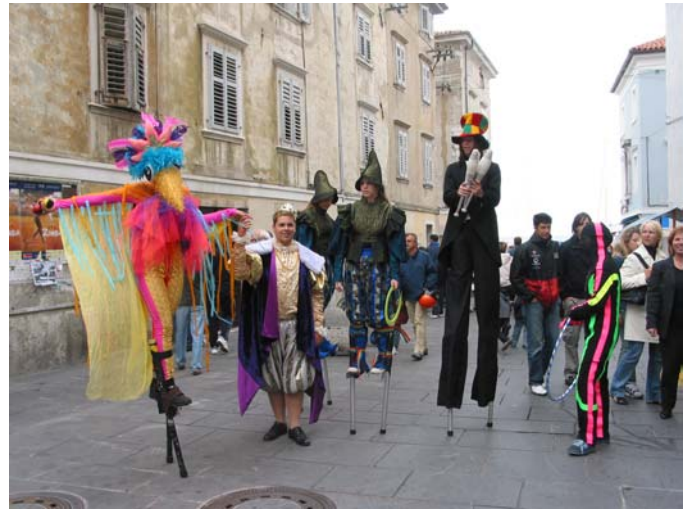
Čirkuška skupina Atrizani .