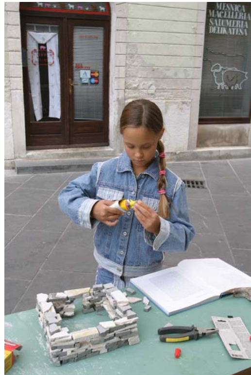
Izdelava istrske hiše iz kamna.