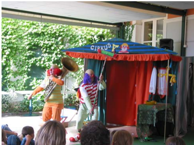
Nerodna Avgušтина , predstava gledališča Studoj Anima je na terasi hotela Tartini zabavala otroke.