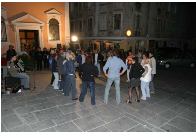
Folklorno društvo VAL Piran je obiskovalce navdušilo za učenje istrskih ljudskih plesov.