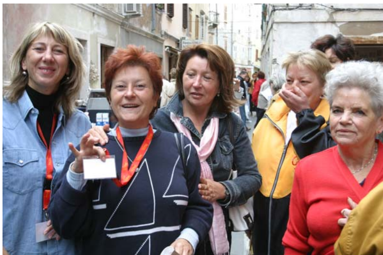
... in njegove članice