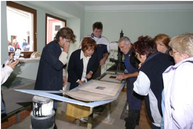
Obiskovalci so zadovoljni z mojstrovo demonstracijo, pričakujejo še barvno verzijo.