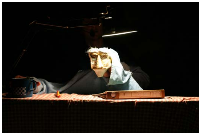
Predstava lutkovnega gledališča Papilu .